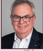
आर.आय.प्रेसिडेंट रो. गॉर्डन आर. मंकडनली